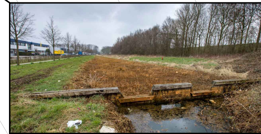
dwarsschotten ivv buffering