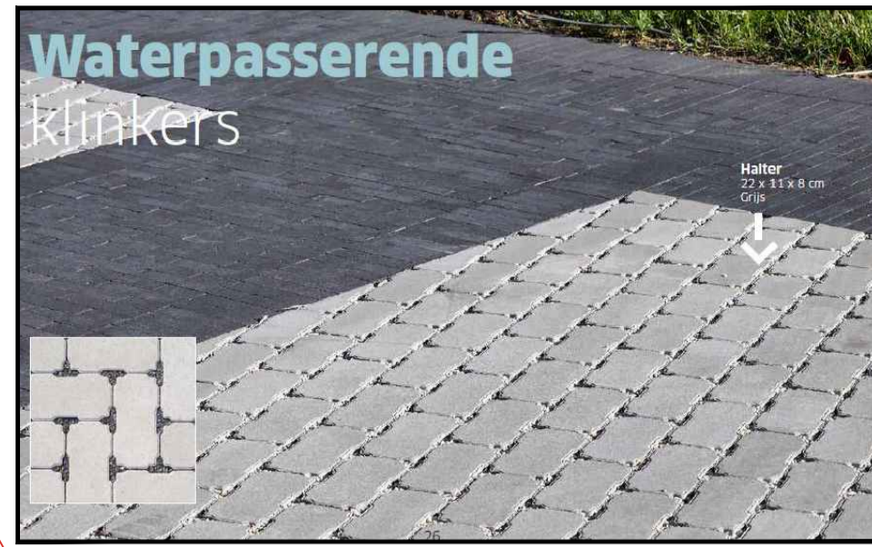
Waterpasserende klinkers voorbeeld rijweg/voetpad