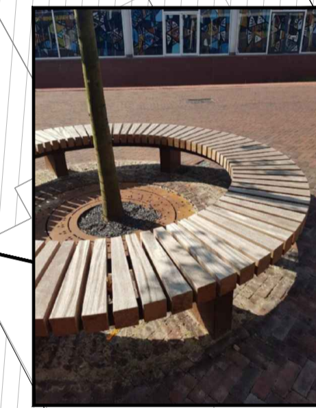
zitbank halve cirkel rond boom