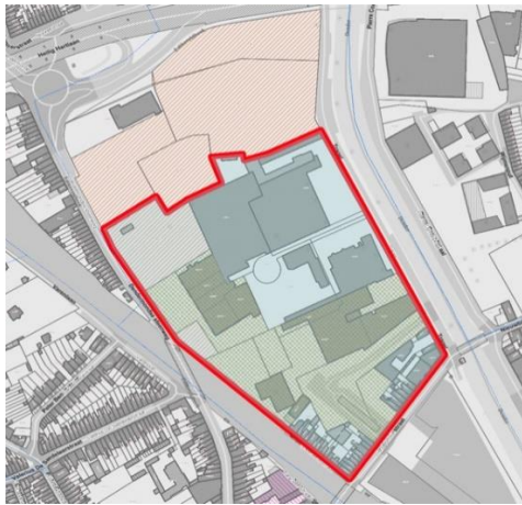
FIGUUR 3: PROJECTAFBAKENING WALSTROOM