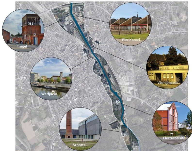
FIGUUR 2: PROJECTAFBAKENING DE KAAIEN