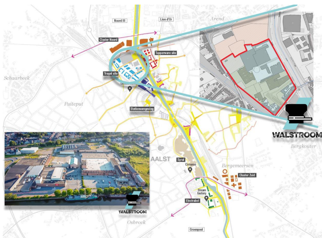
FIGUUR 1: ECONOMISCHE STRUCTUUR AALST

Binnen het Aalsters stadsvernieuwingsproject 'De Kaaien' worden een aantal sites langsheen de Dender op een doordachte manier ontwikkeld en ingevuld. Tegelijk is ruimte in de stad een schaars goed. De site Tragel-Zuid is perfect bereikbaar met de fiets of te voet en dus ideaal om open te stellen voor een breder publiek.