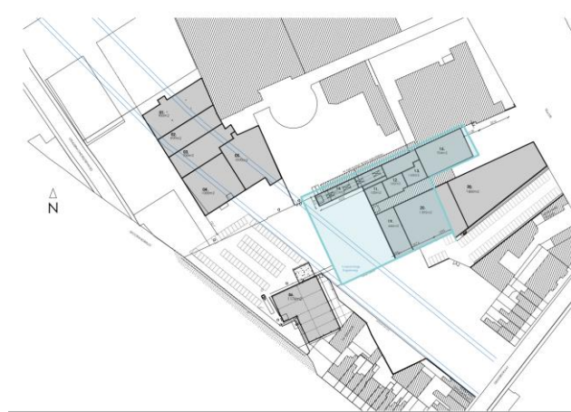
FIGUUR 4: LEEGSTAANDE LOODSEN - WALSTROOM